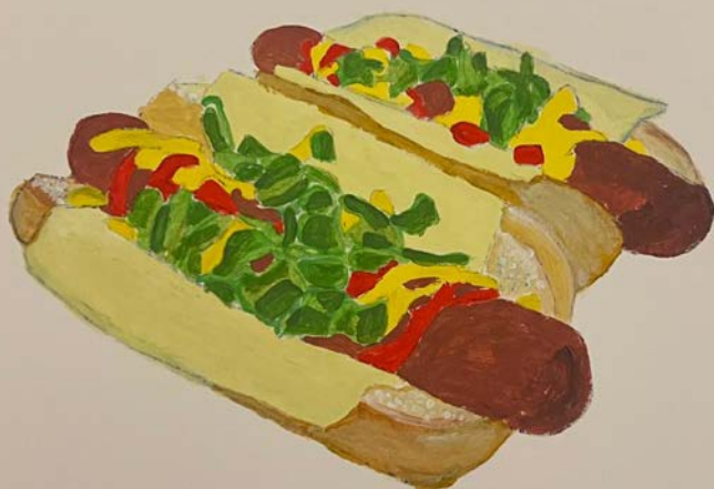
DOBLE DOG CON CHEESE I GHERKIN JORGE VICENTE.L